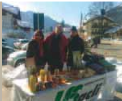
Nelle foto: alcuni momenti della "giornata sugli stili di vita salutari".