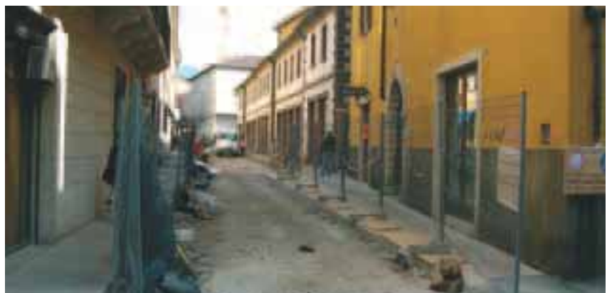
Sopra: suonatore di strada a Trento. Sotto: Via Dordi.